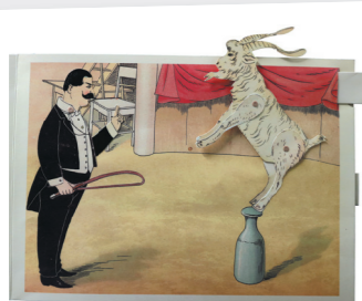
Le Cirque des animaux savants Lothar Meggendorfer 1997 - Albin Michel (1 ère édition 1893)

« Livre animé dont les pages, composées d'illustrations imprimées sur des découpes en cartes fines, se déploient en trois dimensions lorsqu'on les ouvre ». Cette définition, tirée du Dictionnaire encyclopédique du livre , éclaire un mot apparu vers 1930 aux États-Unis puis devenu le synonyme de toute sorte de livre animé.