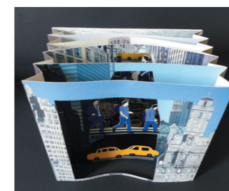
Manhattan Gaëlle Pelachaud 2008 - Éditions Rafaël Andréa

Les volvelles sont des disques concentriques de papier imprimé laissant apparaître une autre image lorsque le lecteur les manipule souvent grâce à une ficelle ou une languette en papier.