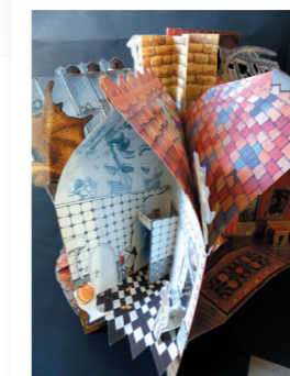
Chambre à louer au musée Jan Pienkowski 1996 - Seuil Jeunesse

Il s'agit d'une autre forme du livre théâtre miniature, appelé également « peep show », « livre étoile » ou « carrousel-accordéon ». Au contraire du livre tunnel qui se déploie frontalement, le livre carroussel s'ouvre à 360°, créant de ce fait plusieurs scènes qui se dévoilent par séquence, ou en faisant tourner l'ouvrage sur lui-même.