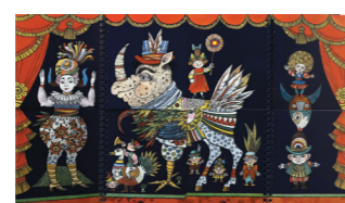
Le théâtre clic-clac Eva Johanna Rubin 1996 - Nord-Sud, DL

Les albums à languettes, en anglais « mix and match », sont également appelés « méli-mélo » ou « arlequinade ». Dans ces albums, les pages sont découpées horizontalement, habituellement en trois parties. Dès lors, les parties de pages ou languettes peuvent se marier entre elles et donner d'innombrables combinaisons.