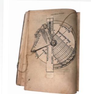
Petri Apiani Cosmographia 1539