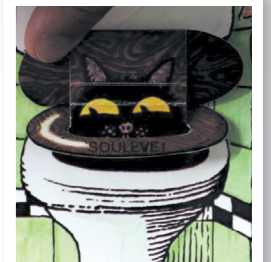
La Maison Hantée Jan Pienkowski 1979 - Nathan

Une pièce de papier vient se superposer sur l'illustration principale. Cette feuille se soulève et révèle une autre image. Le livre à rabats permet de créer des surprises.