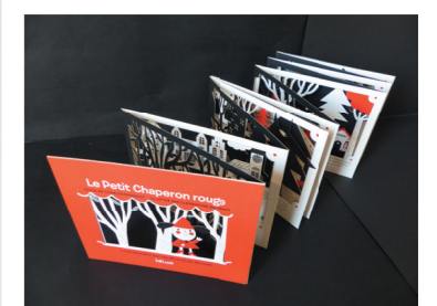
Le Petit Chaperon Rouge Clémentine Sourdis 2013 - Hélicon