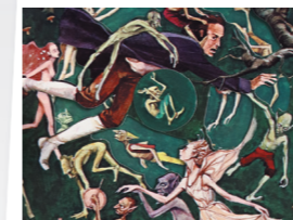
Au pays des fées Claude Pistahd (textes), John Strejan (dessins), James Roger Diaz (mécanismes en papier) 1980 - Nathan

Il est constitué de plusieurs plans imprimés, reliés latéralement par des feuilles de papier, qui, dépliées comme un accordéon, construisent des scènes et des décors visibles en profondeur.